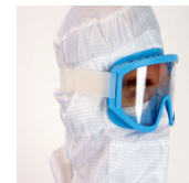
Lunettes de protection